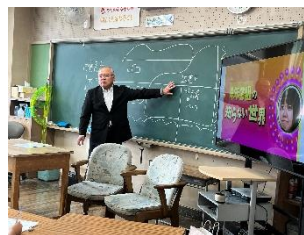
<地域の歴史を学ぶ>

太鼓を継承する人が少ないなどの問題を解決するために、保存会の方々と相談しながら自分たちにできる方法を考え、実践計画を立てた。