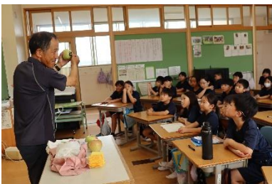
果樹農家の方の話

伊達地区と言えば果物。本校では、毎年、3年生が「アップル探検隊」と称して地域の果樹農家の方々にお世話になりながら体験活動をさせていただいている。