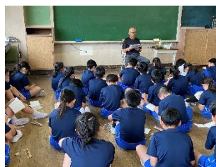
<ゆず生産の現状を知る>

震災後、ゆずの栽培見送りや出荷制限など、生産活動が難しくなっている現状をもとに、各地のゆずの生産状況や活用方法を調べた。また、農家の方々とゆずの収穫作業を行った。