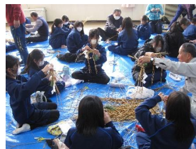
育てた稲わらで しめ縄作り

関わってくださる方々の様子を見ると、活動の中から子どもたちの成長を感じ取り、喜んでくださっている。子どもたちも、地域の方々に親しみをもって接している。まさに協働である。感謝の気持ちと地域愛を育てるべく、カリキュラム